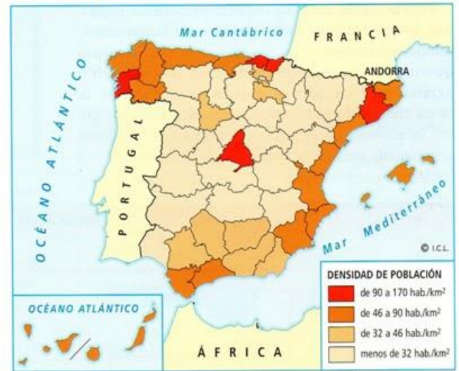
DENSIDAD DE POBLACIÓN EN ESPAÑA A FINALES DEL SIGLO XIX

Las ciudades vivieron enormes cambios tecnológicos y sociales: iluminación de calles con farolas de gas, estaciones de ferrocarril, construcción de redes de alcantarillado. Pero la transformación de mayor alcance fue, primero, el derribo de las antiguas murallas, que impedían su crecimiento, y luego, la construcción de ensanches o barrios de nueva planta, planificada según los criterios del nuevo urbanismo de la época.