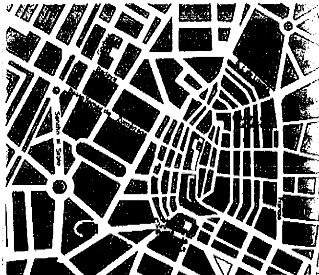
Plano de Vitoria-Gasteiz

Las respuestas se desarrollarán, como máximo, en dos caras de folio, y se valorará con 2,5 puntos.